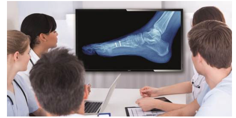
Imagen digital clínica

La imagen digital te ayuda a revisar y analizar imágenes clínicas con un rendimiento de visualización coherente y preciso. Para conseguir realizar interpretaciones clínicas fiables, nuestras pantallas profesionales se suministran calibradas de fábrica con el fin de ofrecer un rendimiento de visualización estándar en escala de grises optimizado. Gracias a la imagen digital, destacará en todos los aspectos del cuidado del paciente.